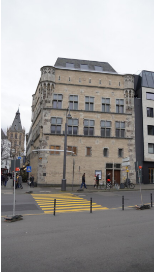
Die Frontansicht der Fassade des Haus Saaleck in Köln mit artothek (2023).