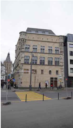
Die Frontansicht der Fassade des Haus Saaleck in Köln mit artothek (2023).