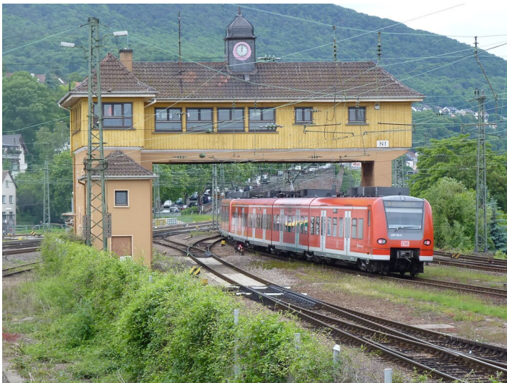
Gebäudeansicht Stellwerk Nf mit S-Bahn (30.05.2014)