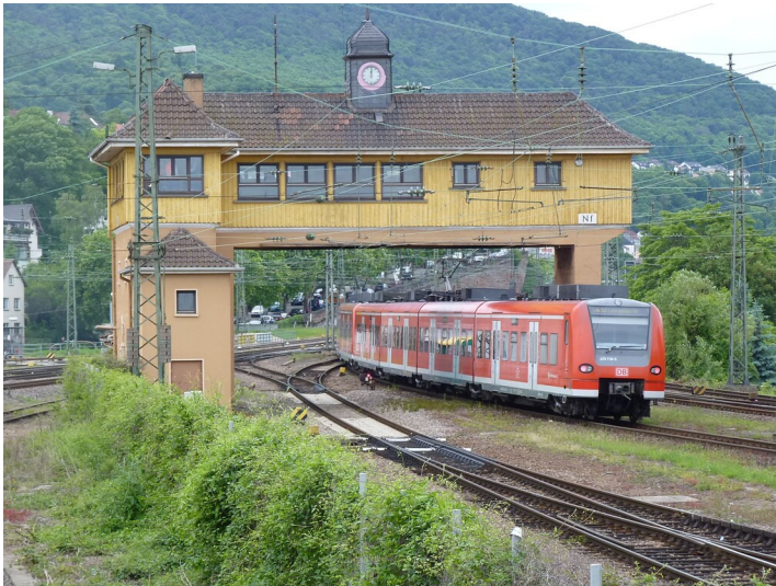
Gebäudeansicht Stellwerk Nf mit S-Bahn (30.05.2014)