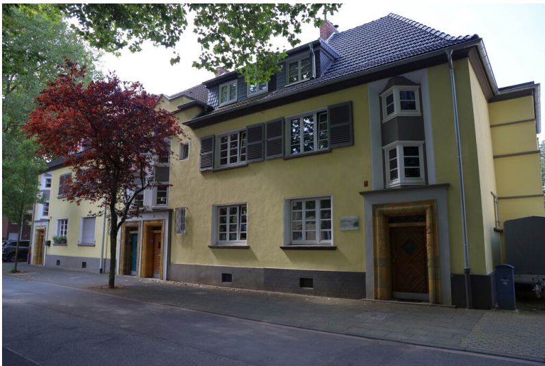
Lehrer- und Beamtenwohnhäuser in der Bartmannstraße (2024)