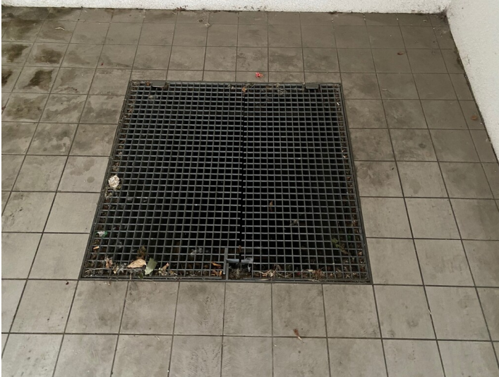
Zugang zum Irdenwareofen in der Alte Straße (2024)