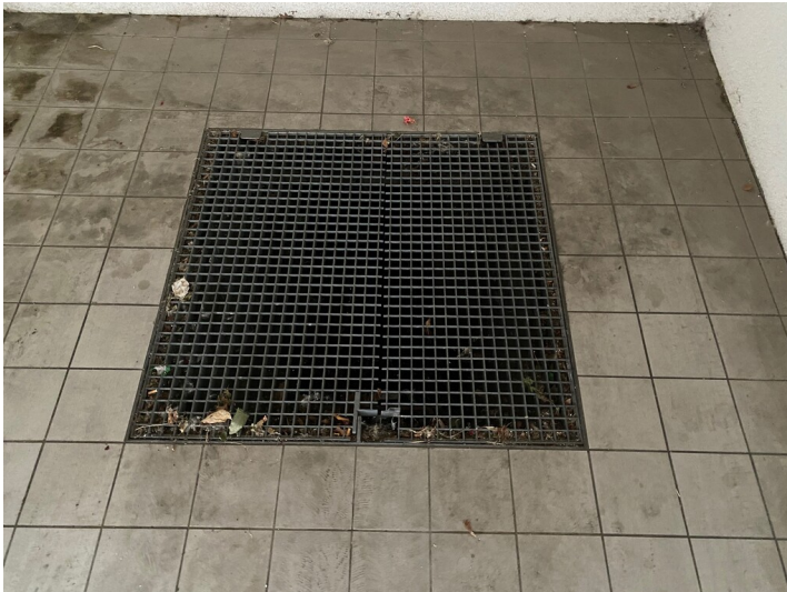
Zugang zum Irdenwareofen in der Alte Straße (2024)