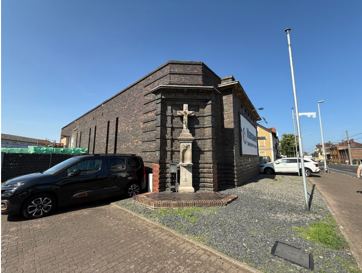
Lagergebäude der Baumaterialienhandlung Cremer mit Wegekreuznische (2025)