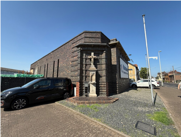
Lagergebäude der Baumaterialienhandlung Cremer mit Wegekreuznische (2025)