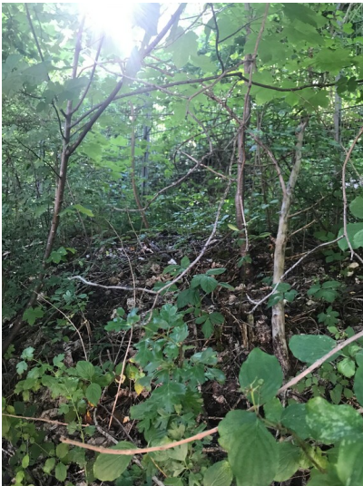
Bereich der Geländerrampe für das Anschlussgleis (2022)