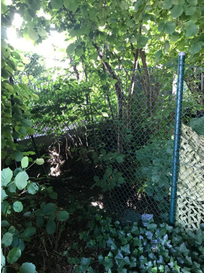
Umzäuntes Gartengrundstück mit erhaltener Böschung entlang ehemaliger Grenze des Fabrikgrundstückes der Steinzeugfabrik Balkhausen (2022)