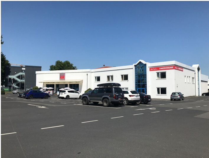
Fabrikgebäude der Steinzeugfabrik H. und J. Geusgen (2022)