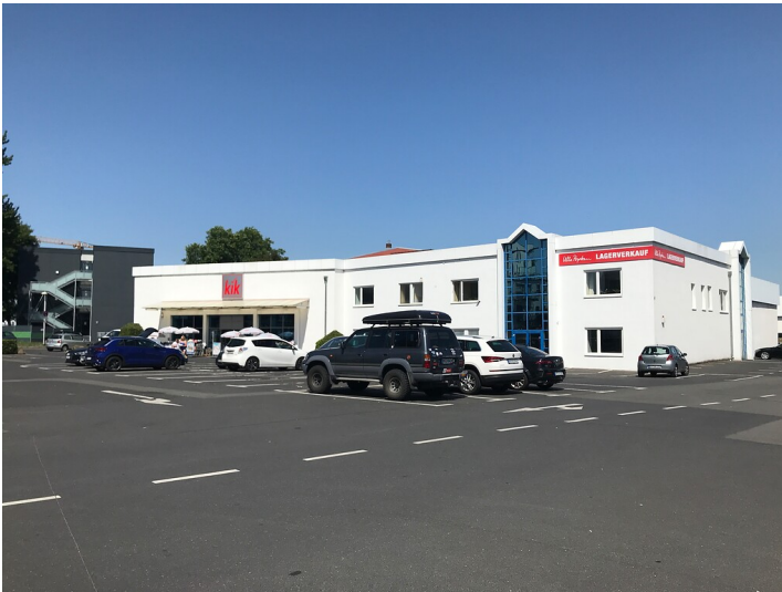
Fabrikgebäude der Steinzeugfabrik H. und J. Geusgen (2022)