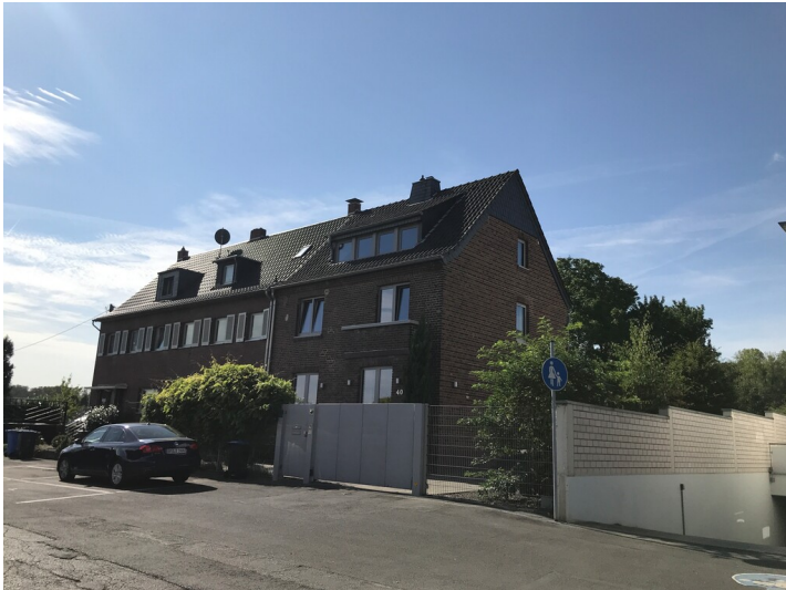
Wohnhaus der Steinzeugfabrik Valentin Roßmann (2022)