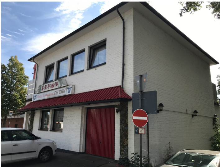
Verwaltungsgebäude der Steinzeugfabrik Hensmann (2022)