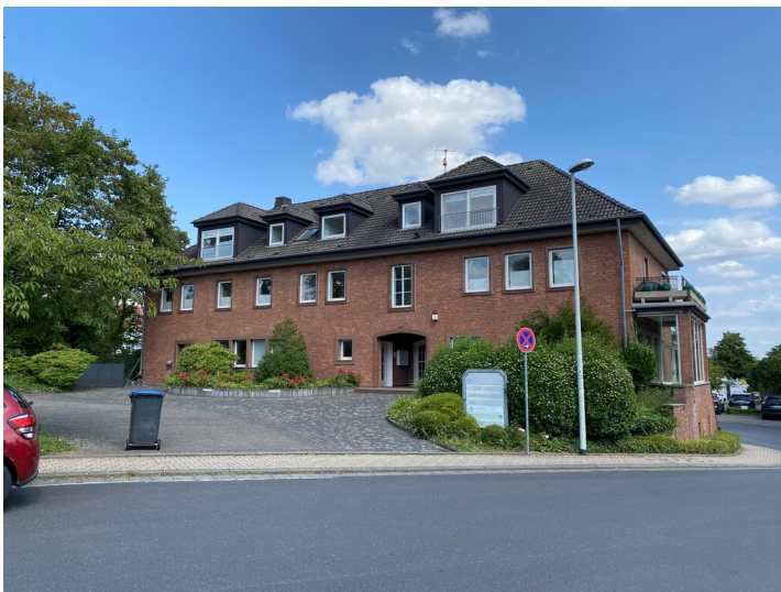
Verwaltungsgebäude des Steinzeugwerkes Grosspeter-Lindemann (2024)