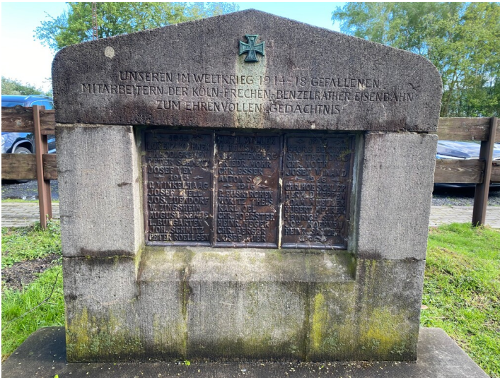
Gedenkstein für die Gefallenen der KFBE des Ersten Weltkriegs (2024)