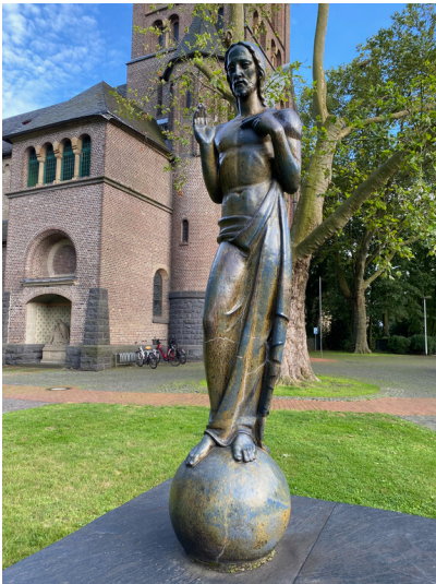
Plastik Christus Welterlöser (2023) Fotograf/Urheber: Nicole Schmitz