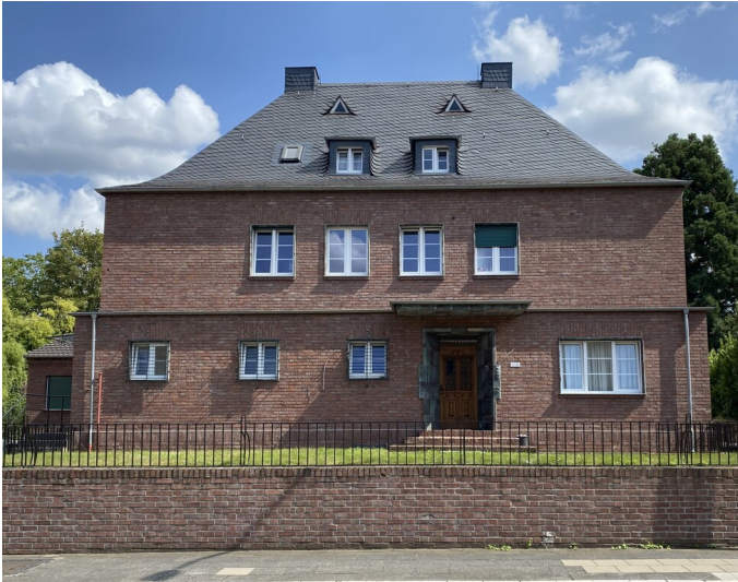
Villa von Toni Ooms in Frechen (2024)