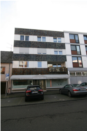
Wohn- und Geschäftshaus mit braun-grau-schwarzer KerAion-Fassade in Frechen (2021)