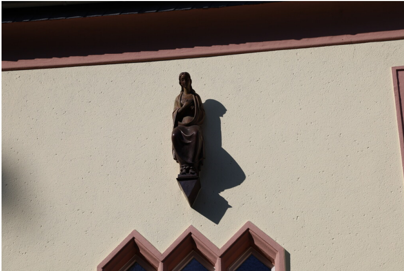
Bauplastik "Madonna" aus Köln-Frechener Keramik (2024)