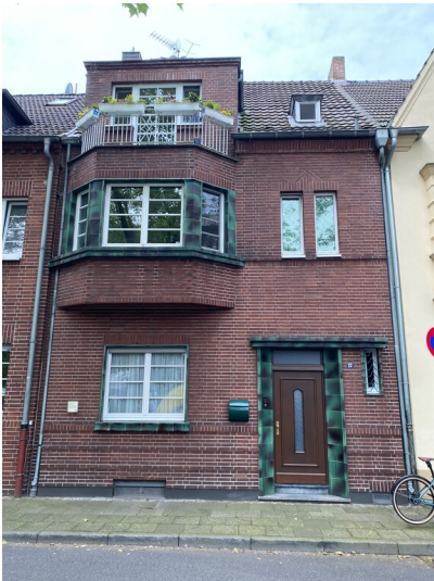
Wohnhaus am Johann-Schmitz-Platz mit Baukeramikelementen (2024)