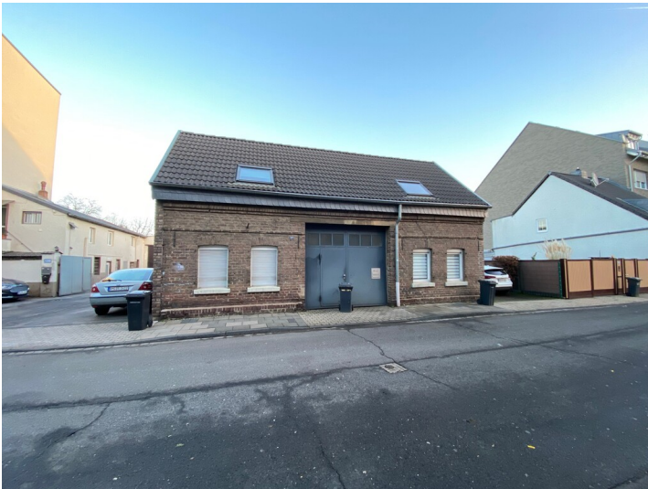
Wohnhaus der ehemaligen Töpferei in der Alte Straße (2024)