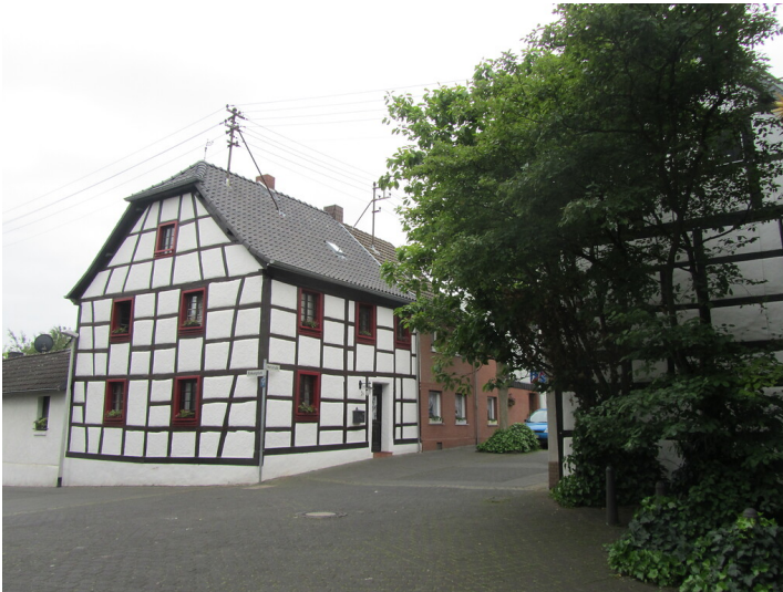
Fachwerkhäuser in der Norkstraße im Oberdorf Frechen (2014)