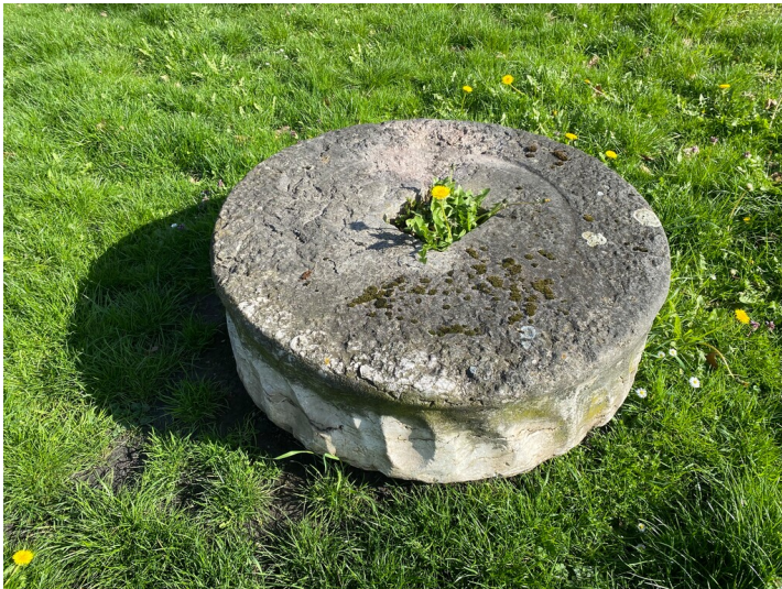
Läuferstein eines Kollerganges (2023)