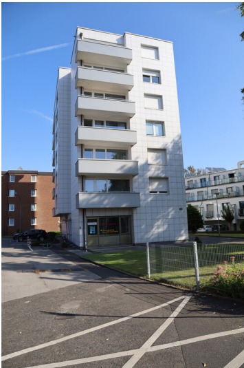
Hochhaus des Werkes Cremer und Breuer in der Kölner Straße (2024)