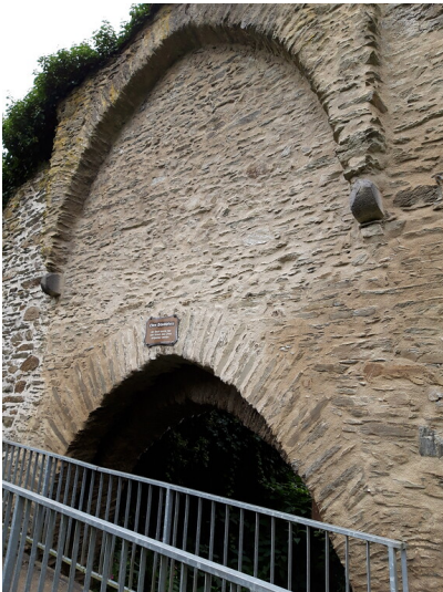
Die Obere Schosspforte in Dausenau (2022)