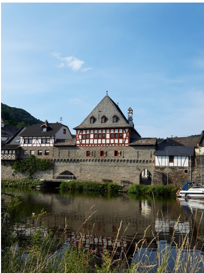
Der Rest des einstigen Christiansturmes in Dausenau (2010)