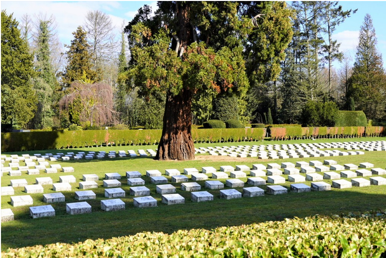
Der italienische Ehrenfriedhof auf dem Kölner Südfriedhof in Köln-Zollstock, Blick auf weiße Gräberreihen (2023).