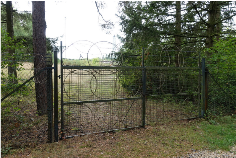
ehem. Sendestelle des Regierungsbunkers Ahrweiler