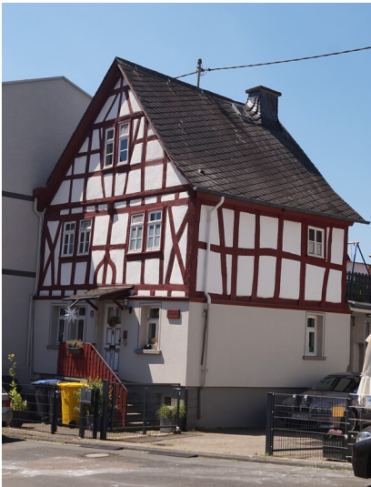
Das Fachwerkhaus in der Kirchgasse 5 in Dausenau (2022)