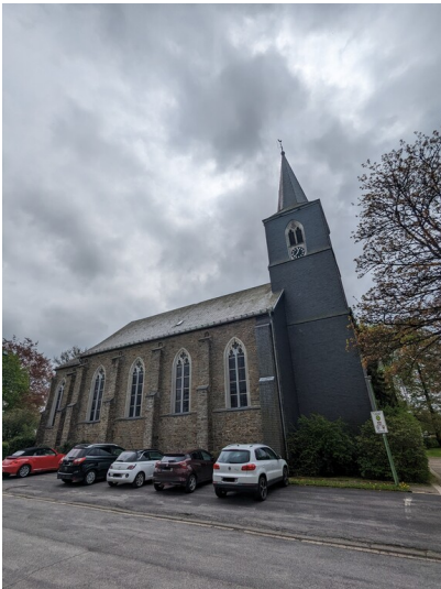
St. Michael in Höfen (2022)