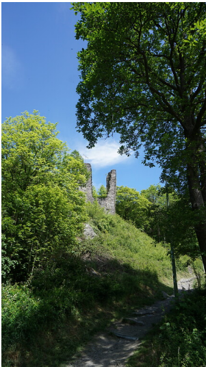
Haller-Ruine (2022)