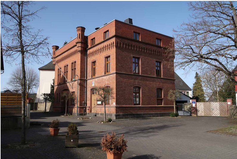
Rathaus in Weisel