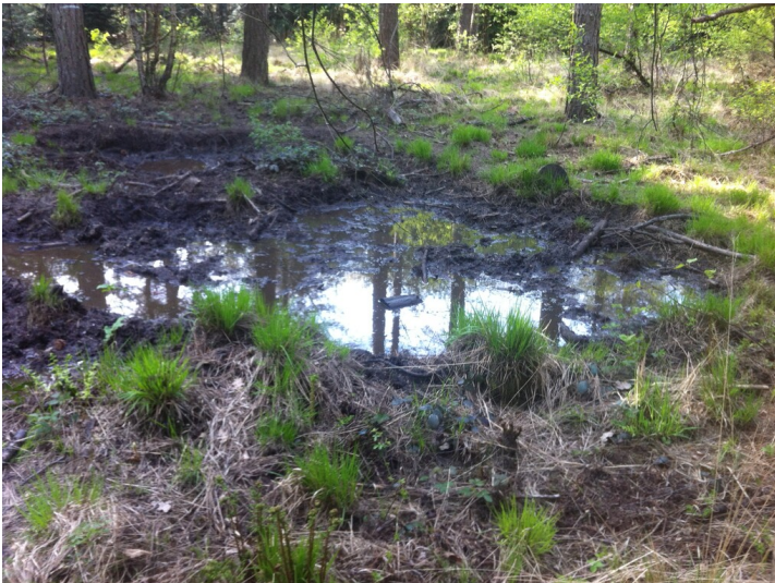
Suhle nahe Haus Grunewald (2017)