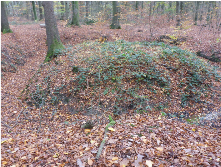
Quellgraben (2020)