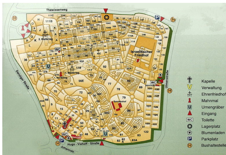
Lageplan des Nordfriedhofs Düsseldorfs, darin ist die Parzelle des Neuen Jüdischen Friedhofs als "Israelitischer Friedhof" ausgewiesen (2015). Der Alte jüdische Friedhof an der Ulmenstraße liegt nur rund 200 Meter südöstlich des Nordfriedhofs.