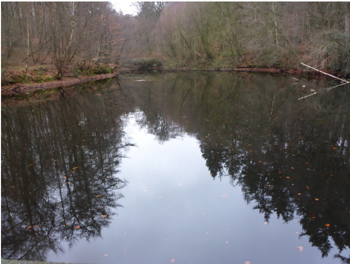
Quellteich (2023)