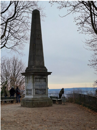
Der Tranchot-Obelisk auf dem Lousberg in Aachen (2022)