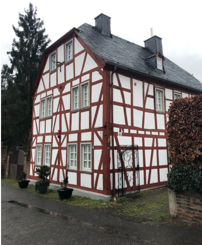
Trierer Hof in Sinzig (2024)