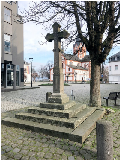
Wegekreuz am Kirchplatz in Sinzig (2023)