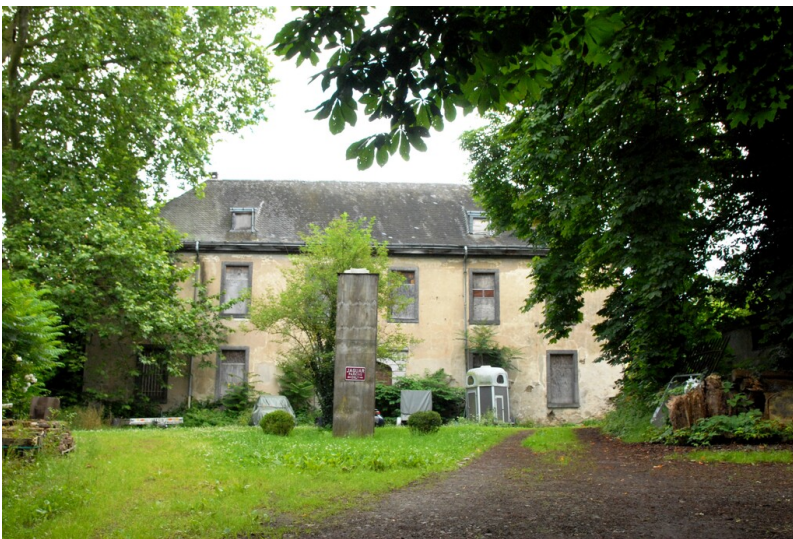
Kloster Helenenberg in Sinzig (2016)