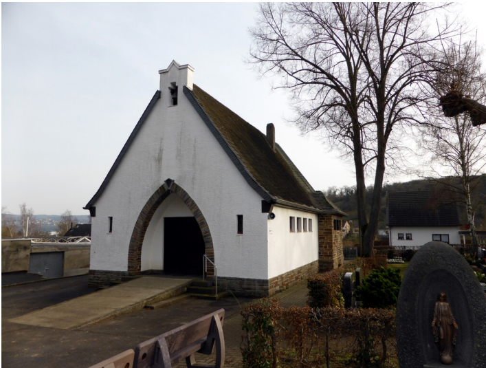
Friedhofskapelle auf dem Kommunalfriedhof in Sinzig (2015)