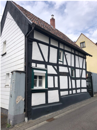
Fachwerkhaus Kirchgasse 7 in Sinzig (2023)