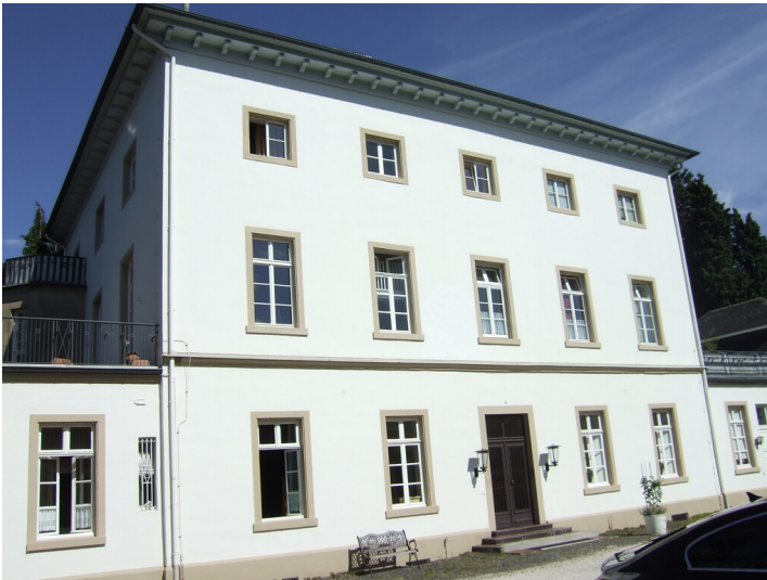
Haus Schönberg in Sinzig (2013)