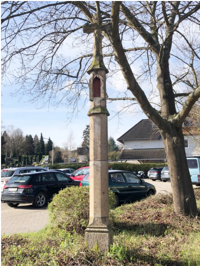
Steinkreuz an der Koisdorfer Straße in Sinzig (2023)