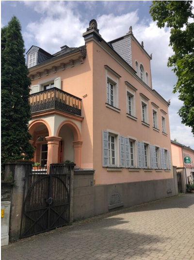
Wohnhaus Kölner Straße 4 in Sinzig (2023)