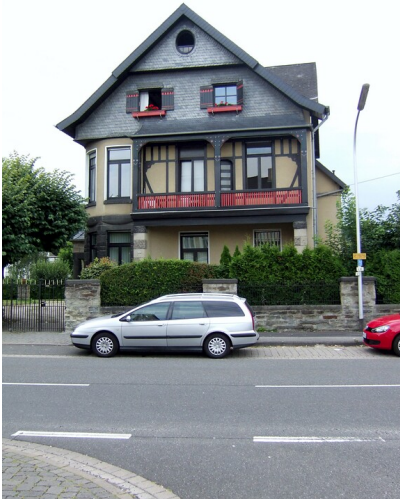
Villa Kölner Straße 8 in Sinzig (2013)