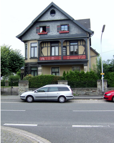
Villa Kölner Straße 8 in Sinzig (2013)