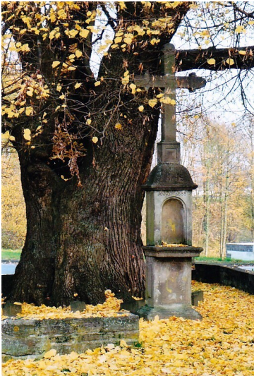
Pestkreuz Lindenstraße / Ecke Koblenzer Straße in Sinzig (2009)