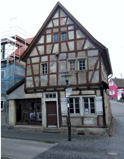
Fachwerkhaus Mühlenbachstraße 1 in Sinzig (2013)