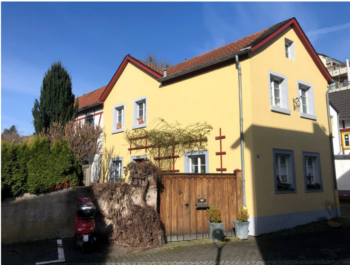
Fachwerkhaus Renngasse 17 in Sinzig (2023)